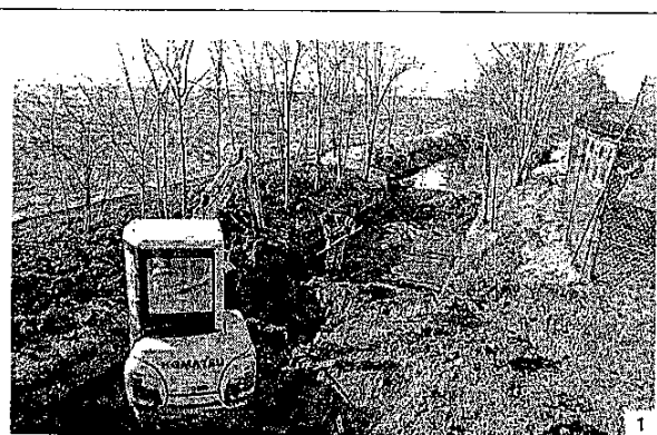
1) Ruspa al lavoro nella roggia del Serio Morto inferiore. 2) Il Serio Morto superiore e il laghetto San Marcello